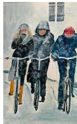
Winter-Riet te Winkel