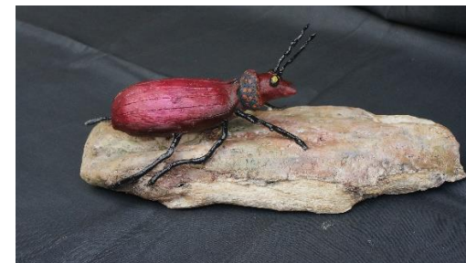
Kever - Fátima Toco São Pedro