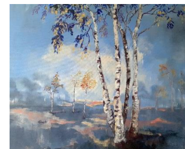
Lente - Gerda Verduin