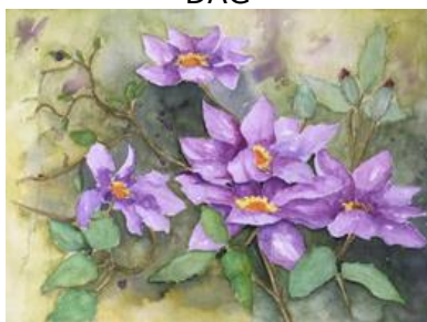
Bea van Buuren