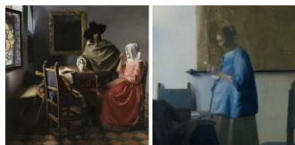
'Meet Vermeer' - Mauritshuis - Den Haag

Er is goed nieuws. Ondanks dat de musea op dit moment dicht zijn, kan je ze nog steeds bezoeken, gewoon via de computer. Een deel van de collectie van bekende musea is nu via internet te bewonderen. Je hoeft de deur niet uit en je kunt ze vanaf je bank bekijken. Een aantal musea biedt gratis virtuele tours aan. Ga mee op reis en dompel je onder in de kunst.